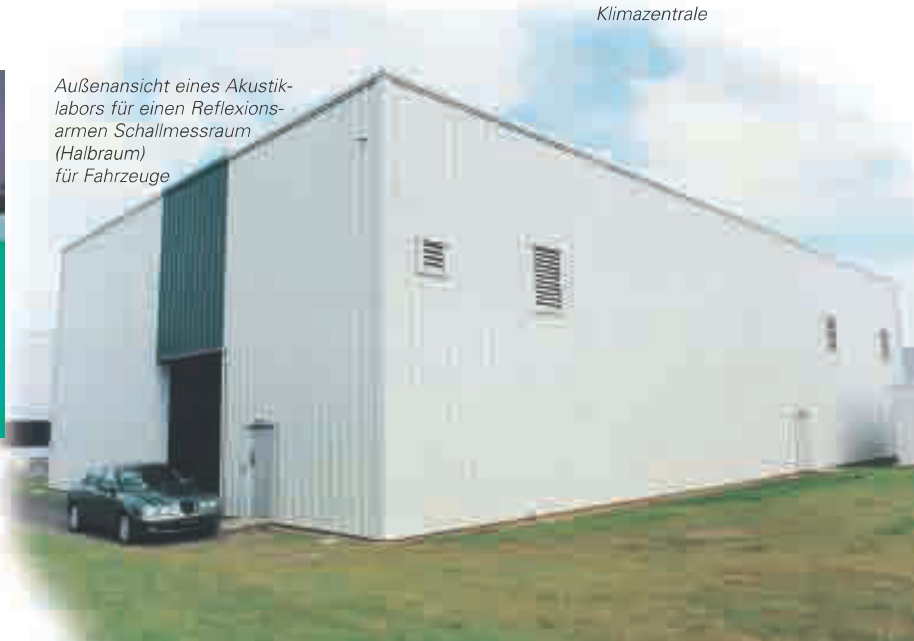
Außenansicht eines Akustiklabors für einen Reflexionsarmen Schallmessraum (Halbraum) für Fahrzeuge