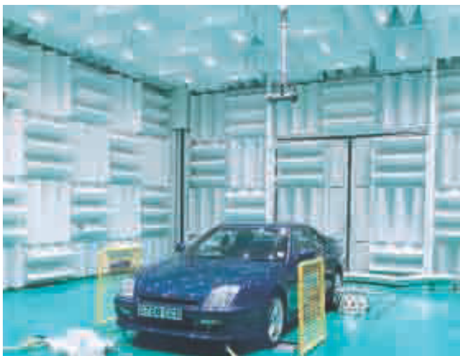
Reflexionsarmer Schallmessraum als Halbraum