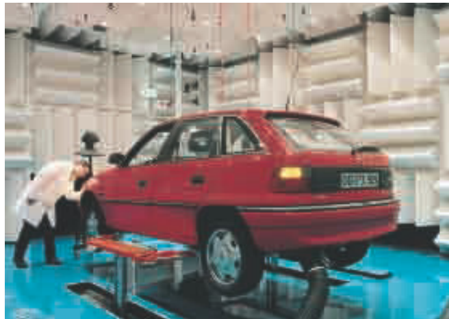
Reflexionsarmer Schallmessraum als Halbraum bei Delphi Automotive Systems in Luxemburg