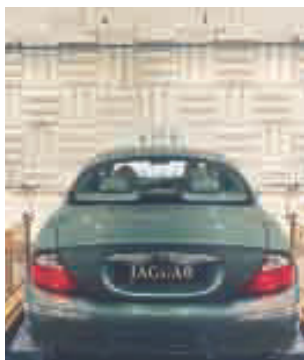
Reflexionsarmer Schallmessraum als Halbraum

Audi Porsche Continental BMW Daimler Chrysler Rover Group Nissan Toyota Tennex Europe Delphi Automotive Systems Siemens Automotive Systems Faital Créos IMS Morat und Söhne Sebring