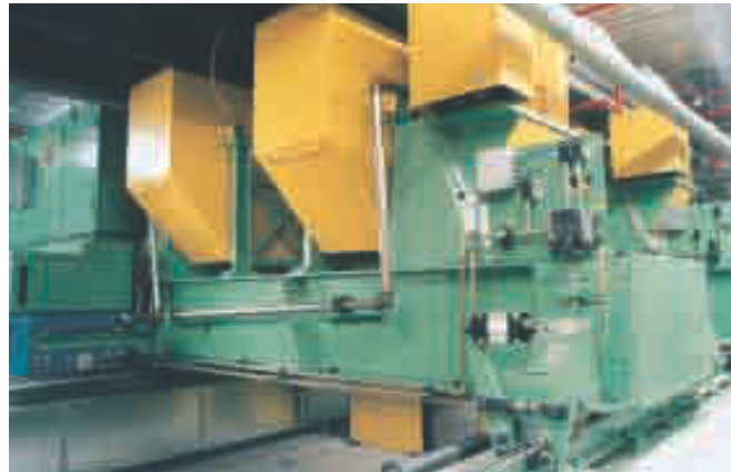
Vierradantrieb Chassis Dynamometer