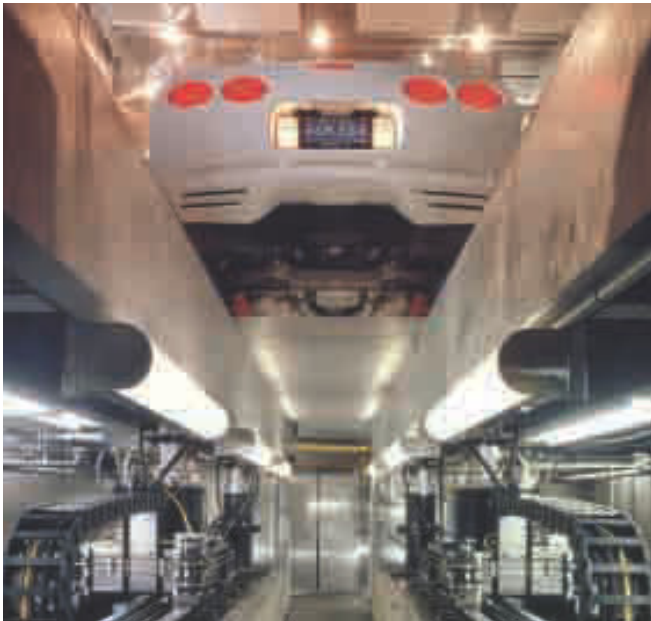
Prüfraum für Umweltsimulation