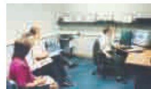
Prüfraum für Schall-Qualitätsmessungen bei Siemens Automotive Systems