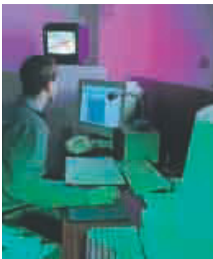
Kontrollraum eines Reflexionsarmen Schallmessraums

Schlüsselfertige Produktion und Übergabe der Akustik-Test- und Messräume unter Berücksichtigung geltender Vorschriften und Normen.