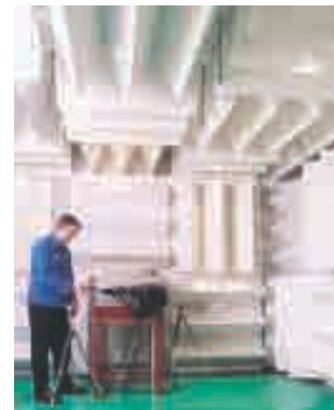
Testraum „weißes Rauschen“