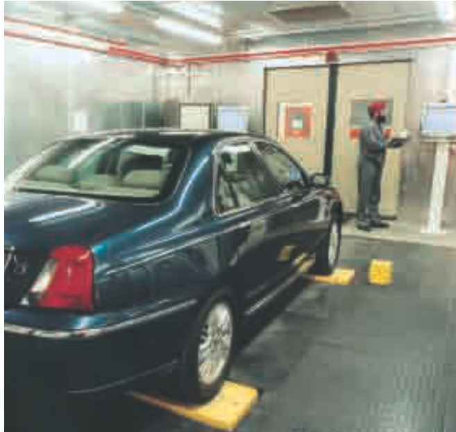
Prüfraum für Rüttel- und Vibrationstests