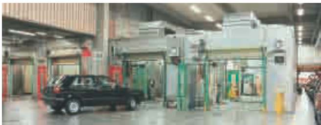
Rollenprüfstände bei Volkswagen, Brüssel, für die Endkontrolle