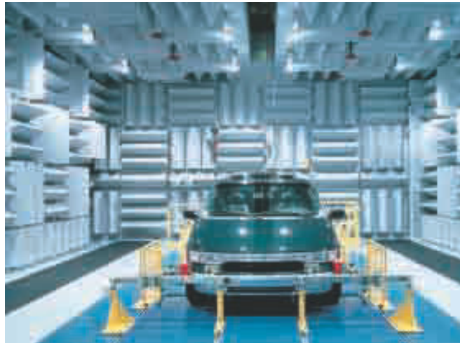
Reflexionsarmer Schallmessraum als Halbraum