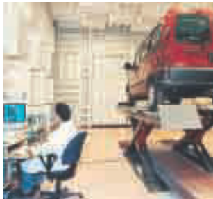
Reflexionsarmer Schallmessraum als Halbraum

Neben den direkt bei IAC beschäftigten Spezialisten, arbeitet IAC mit Fachingenieuren aus anderen Disziplinen zusammen und gewährleistet so eine effektive Projektabwicklung. So hat die IAC zum Beispiel in Kooperation mit verschiedenen europäischen Konsultanten im Automobil-/Fahrzeugbereich gearbeitet, um damit ein höchstes Maß an Qualität in Bezug auf die technische Ausführung und Projektabwicklung zu erzielen. Außerdem bestehen Verbindungen zu einer Reihe von bekannten Anlagenherstellern, zum Beispiel Prüfstandsherstellern in Europa.